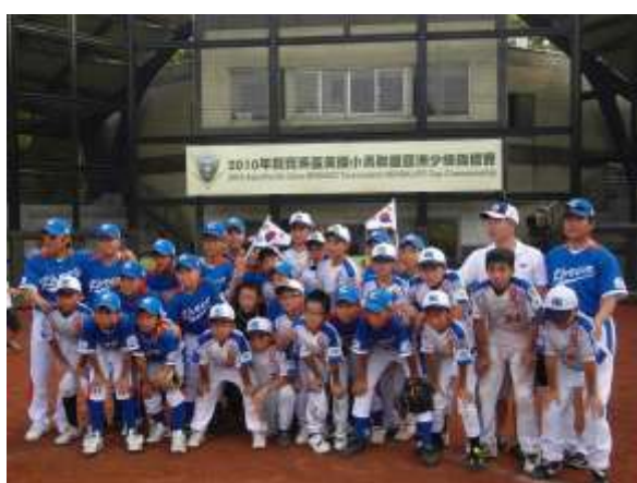
香港隊與韓國隊比賽後合照