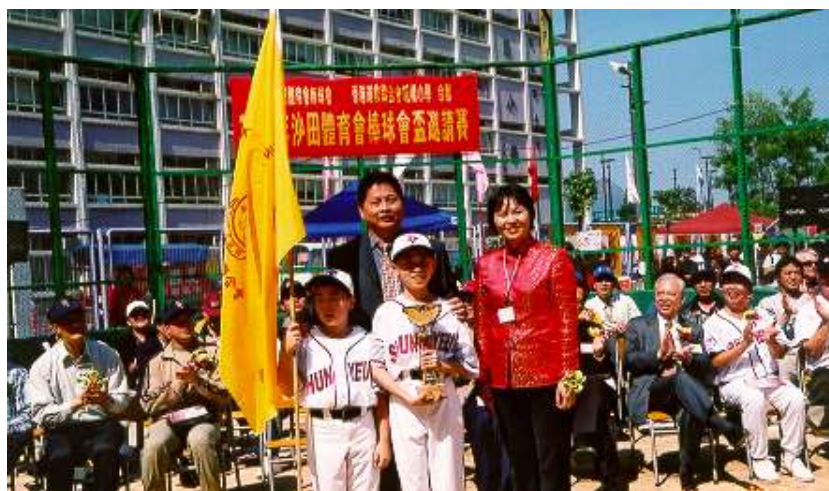
「2002 年度沙田體育會棒球會杯」本校獲「優勝杯」

棒球隊於 2002 年成立，並在 2 月 14-16 日，本校參與由沙田體育會棒球會舉辦之「2002 年度沙田體育會棒球會杯」海外少棒邀請賽，於小學組中，本校棒球隊首戰馬鞍山循道衛理小學棒球隊獲勝，得優勝杯，對起步階段的隊員，這確是一股強大的推動力。