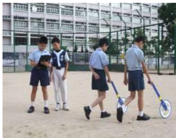
同學分別以拉尺及滾輪量度棒球場的周界