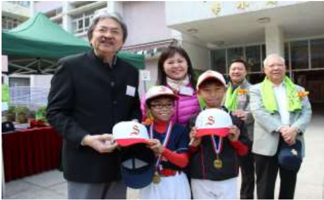
棒球隊員贈送棒球帽予曾司長

財政司司長曾俊華先生 GBM, JP 於 2014 年 12 月 28 日蒞臨本校，主持「2014 沙田節少年棒球邀請賽決賽開球禮」。