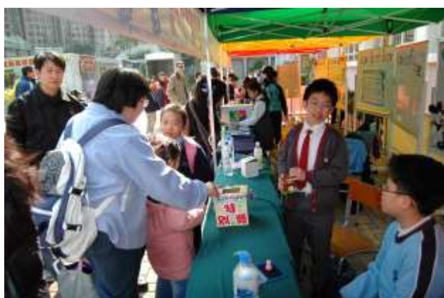
攤位遊戲：親子棒球碰碰樂