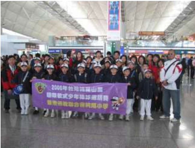
2006年諸羅山盃 國際軟式少年棒球邀請賽花絮