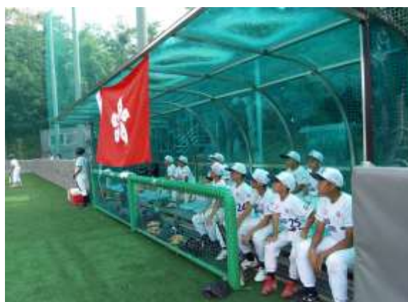
球員在廂座等待出場