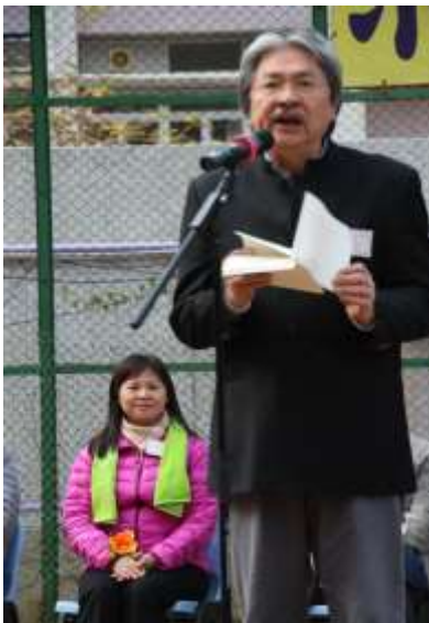
梁校長陪同曾司長主持開球禮