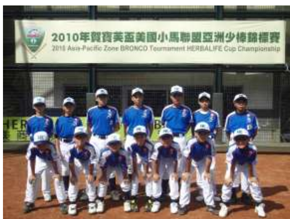
香港棒球代表隊在「美國小馬聯盟亞洲少棒錦標賽」比賽場地留影

純陽棒球隊代表香港於 2010 年 7 月 17-24 日前往台北參加「美國小馬聯盟亞洲少棒錦標賽」。賽事共有 7 個國家球隊參與，分別有中華台北、南韓、日本、菲律賓、香港、越南及印尼。雖然在小組賽中，我們輸給韓國及菲律賓，但在最後的名次賽，我們戰勝越南及印尼，獲得第 5 名，為賽事劃上圓滿句號。經過 4 場的比賽，球員無論在體能技術，以及隊形紀律等都有得著。此外，球隊返港後，又會為新一屆比賽作準備，於 7 月 25 日至 8 月 1 日前往東莞進行 8 天集訓，期間，我們亦會邀請台灣資深教練協助，提升技術之餘，又可建立球員間的默契。在酷熱的天氣下，球員聚精會神的打好每個球，家長的吶喊聲此起彼落，教練運籌帷幄，正是團隊合作的反映。參與其中，可說是獲益良多。