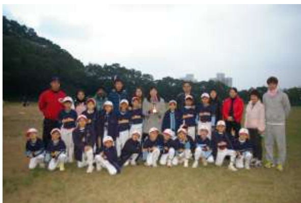
校長、家長、教練分享隊員獲獎的喜悅