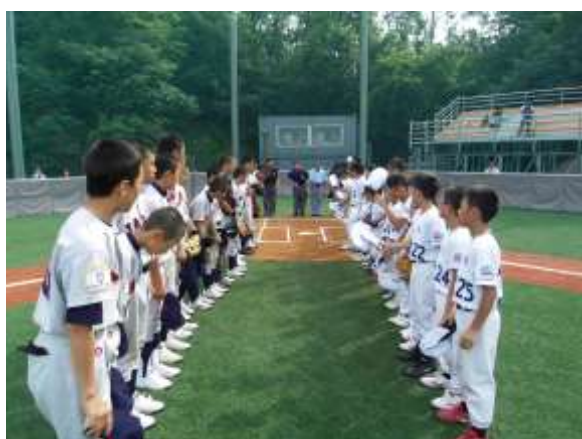
先禮後兵，雙方棒球員在比賽開始前列隊握手