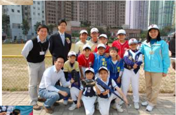
楊文銳議員、校監和校長與各隊球員合照