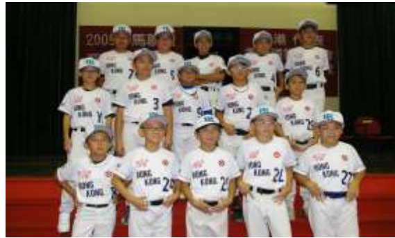
15 位參與「2009 小馬聯盟(BRONCO 組)亞太區錦標賽」的香港棒球隊代表