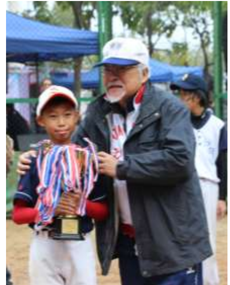
本校棒球隊在表演賽中獲得冠軍