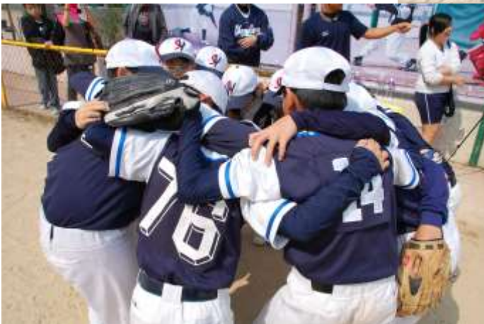
球員響應曾特首呼籲「打好呢場波！」