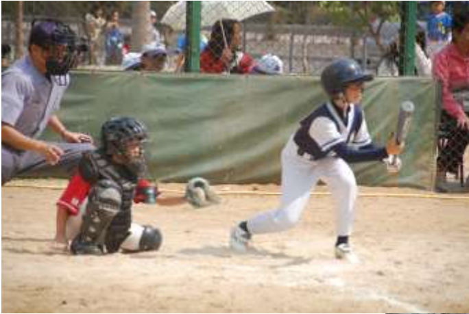
擊球員和捕手全神貫注的準備迎接投手的來球