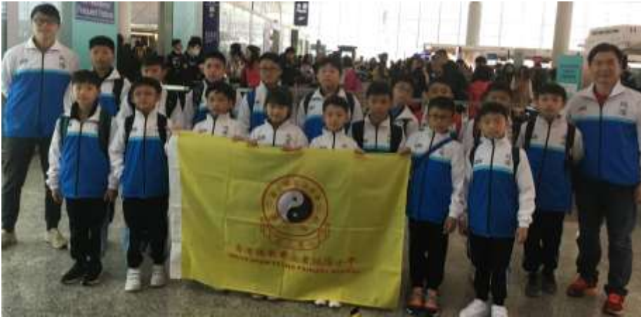
出發前在香港機場影大合照