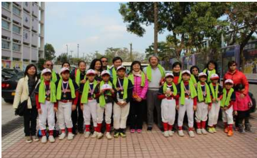
曾司長與校長、棒球員及家長合照