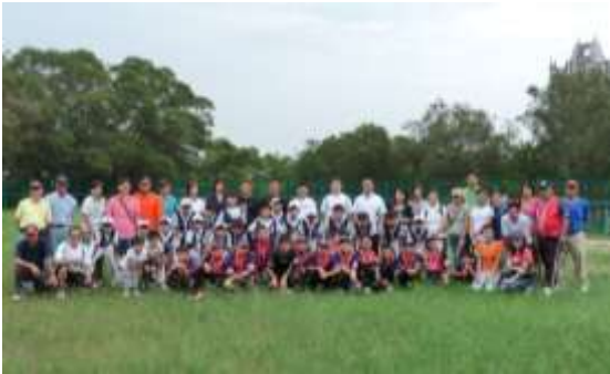
純陽小學棒球隊在香港區資格賽事中獲勝

本校棒球隊在「2009 小馬聯盟(BRONCO 組)亞太區錦標賽」香港區資格賽事中獲勝，代表香港出席於 2009 年 7 月 18-24 日，在南韓首爾舉行之比賽，與南韓、日本、中華台北等國家地區球隊爭奪殊榮。7 月 14 日，我們更參與一個簡單而隆重的香港區旗授旗禮。