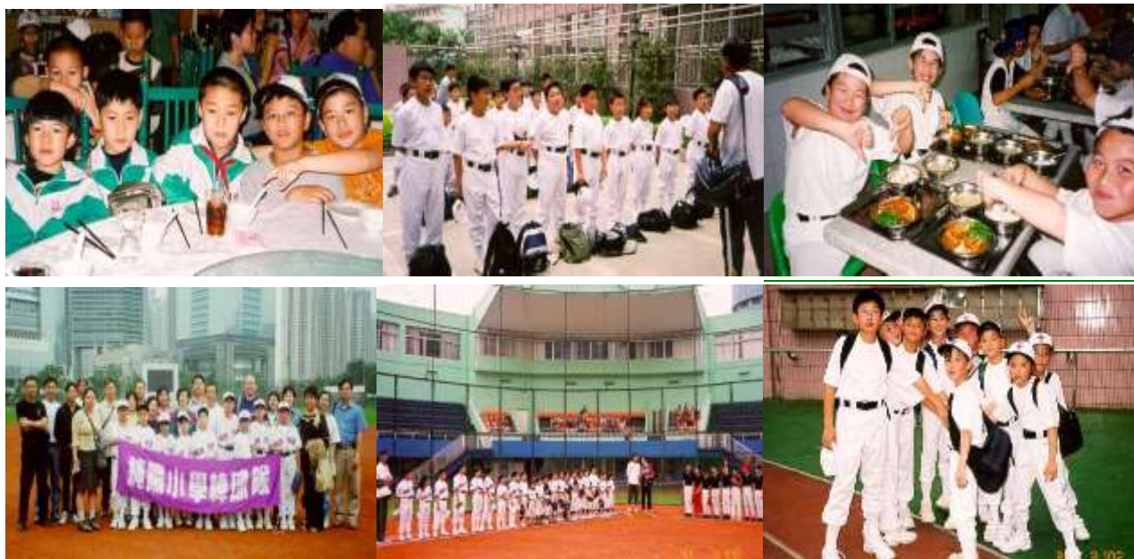
廣州集訓之旅花絮

棒球隊於復活節期間 2002 年 3 月 31 至 4 月 2 日，聯同沙田體育會棒球會隊員北上廣州，進行一連三天的集訓。隊員還參觀【中國職業棒球聯賽】廣東隊主場-----「天河棒球賽」，到桂花崗小學觀課，參加升旗禮，進行友誼賽等，不但增進球員的棒球技術，更是一次難得的中港文化交流。