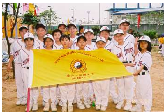
全力以赴，爭取好成績

2002 年 3 月 28、29 日，棒球隊又參加優質教育基金「沙田兒棒精英培訓計劃」邀請賽，與沙田循道衛理小學、馬鞍山循道衛理小學及沙田體育會棒球隊展開激戰，最後獲得亞軍。對於初成立的球隊來說，首年的成績實是一股動力，推動棒球隊繼續努力，爭取好佳績。