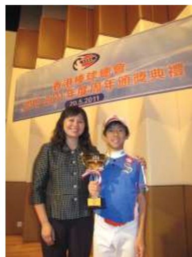
梁校長及溫爵鑫在頒獎禮上合照