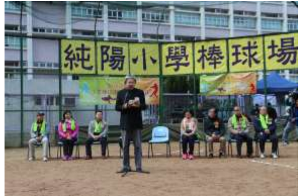
曾司長致詞勉勵各球員