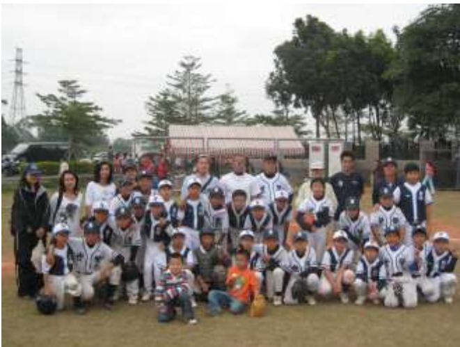
2007年諸羅山盃 國際軟式少年棒球邀請賽花絮