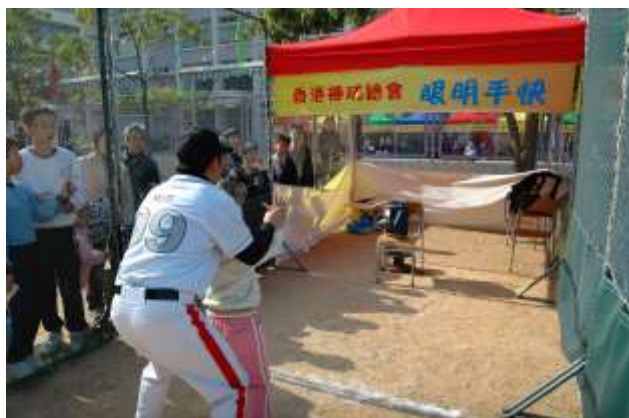
攤位遊戲：眼明手快

二零零七年一月七日，本校與香港棒球總會合辦「親子棒球樂繽紛」，一方面推廣棒球活動，另一方面將棒球元素融入中文、英文、數學、視覺藝術等學科學習之中。當日除學科活動外，學校及棒球總會還設計了多個攤位遊戲，如「眼明手快」、「聲東擊西」、棒球表演賽等，讓同學對棒球的認識更多、更深入。