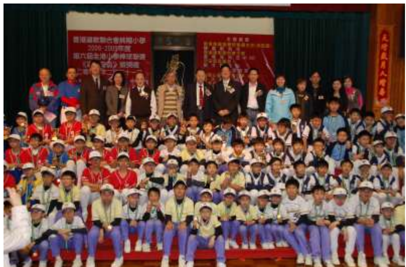
各隊球員難得聚首合照