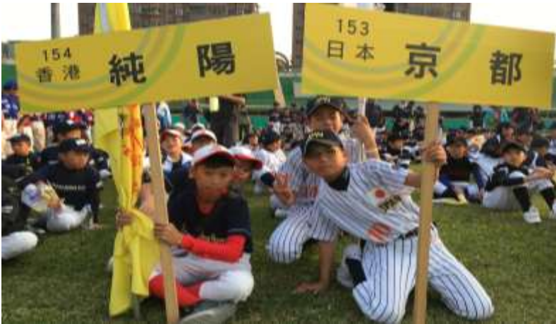
全隊球員參與巡遊活動，在嘉義市棒球場舉行開幕典禮