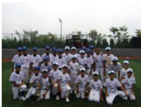
香港棒球代表隊與賽事冠軍中華台北隊合照