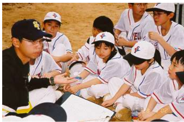
教練與球員商量戰術