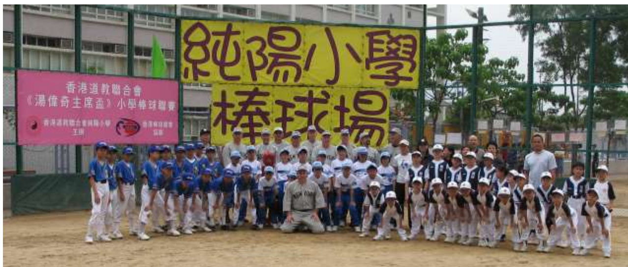
前美國職業棒球員到校探訪時，與本校棒球隊及其他參賽學校球員合照