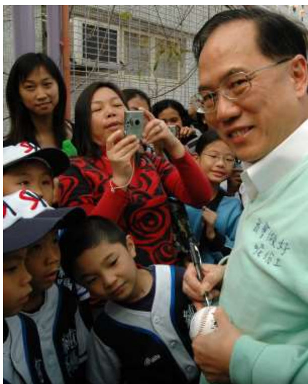
曾特首為球員簽名留念