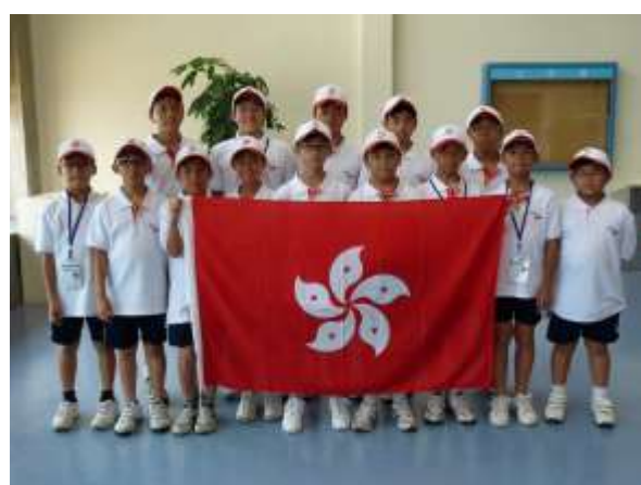
棒球隊在台北機場留影