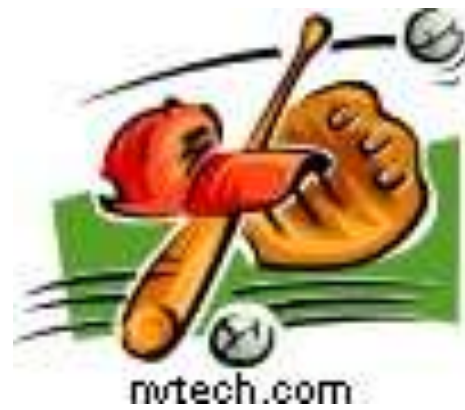
2008 年諸羅山盃 國際軟式少年棒球邀請賽花絮